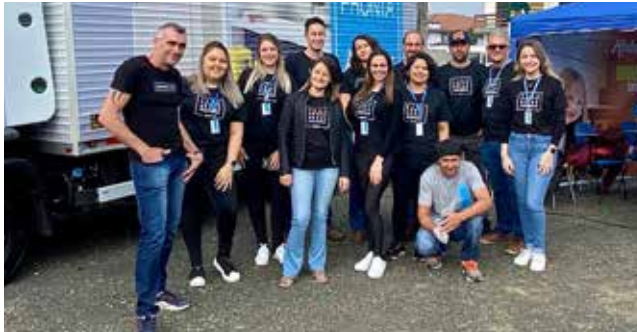
Grupo da Rohden Portas e Painéis do evento de Pouso Redondo

“Para mim a Rohden é a minha segunda casa, onde eu aprendi muitas coisas. Foi meu primeiro emprego. Aqui eu comecei a construir meus sonhos, onde eu aprendi a dar valor nas minhas conquistas, aprendi que ali não é só trabalhar é também cuidar e valorizar o colega de trabalho, porque não depende de uma só pessoa para crescer e evoluir. Aqui é uma segunda família onde passamos a maior parte do tempo, aprendemos a