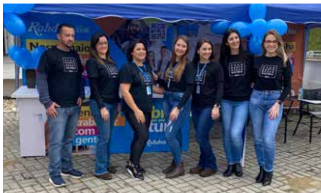
Grupo da Rohden Vidros do evento de Taió