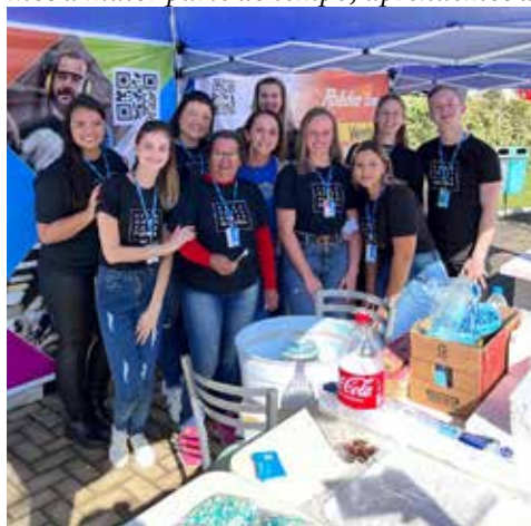
Grupo da Rohden Artefatos do evento de Saleté

respeitar o limite de cada pessoa, aprendemos a dar conselhos e receber, aprendemos o que é certo e errado.