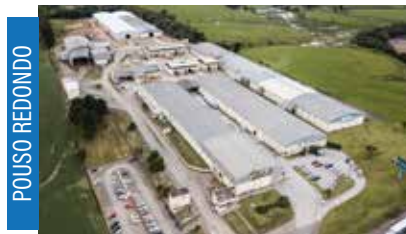
Rohden Portas e Painéis