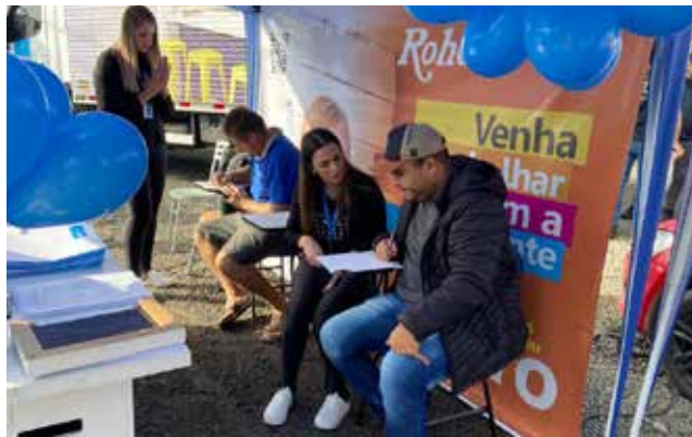
Conhecendo nossos possíveis novos talentos da Rohden.