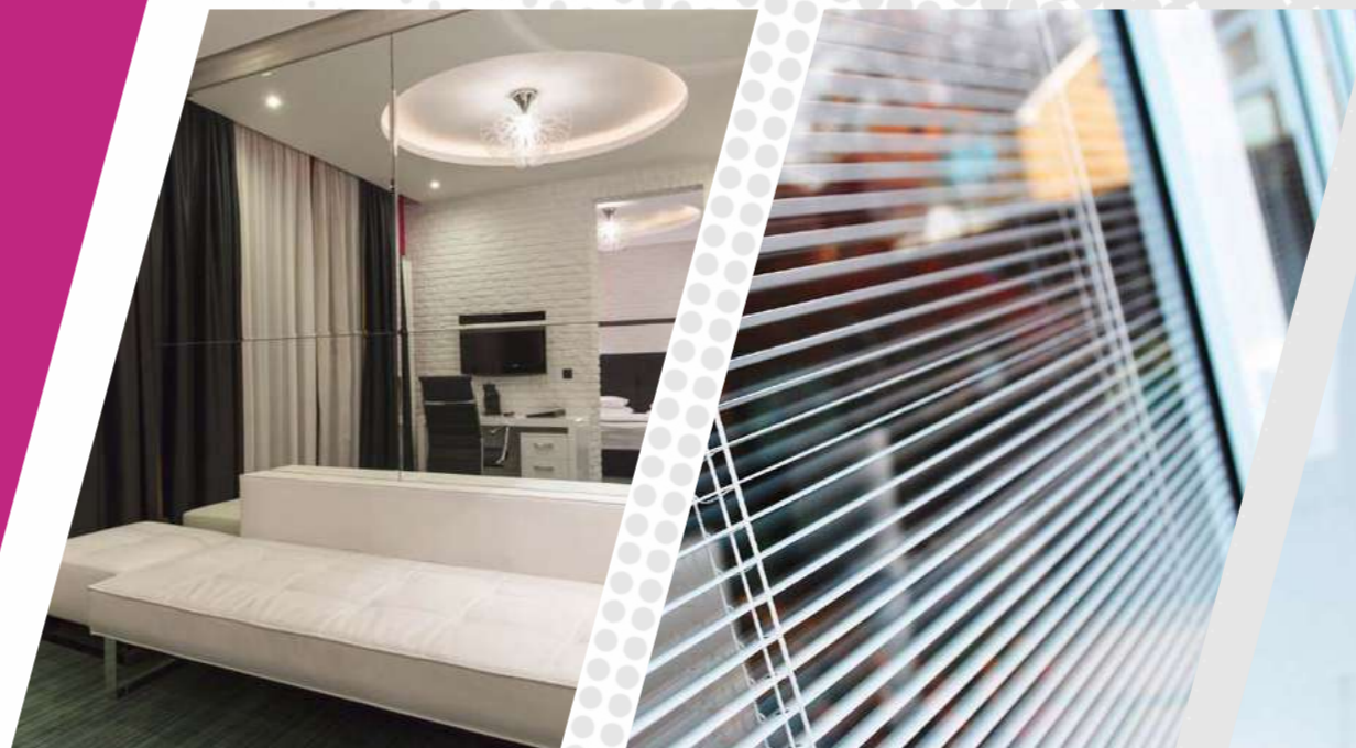
Vidro insulado com aplicação de persiana interna