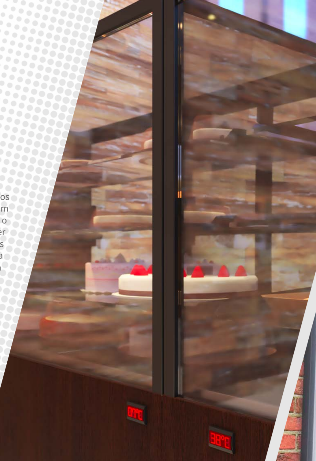
Vitrines expositoras serigrafadas para padaria

Os produtos Rohden são desenvolvidos para garantir a máxima eficiência em isolamento térmico, diminuindo o consumo de energia, visando manter a alta qualidade dos produtos armazenados. Tudo isso aliado a um design moderno e com ampla visualização.