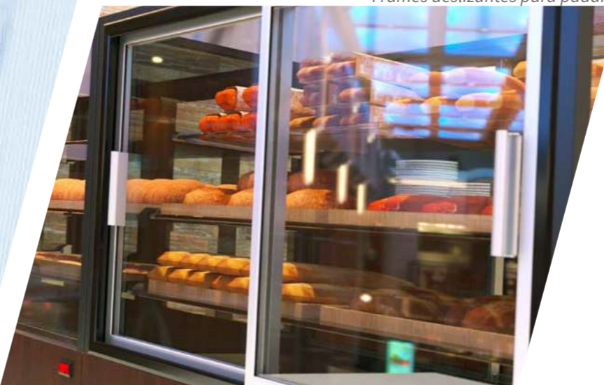
Frames deslizantes para padaria

Dispomos de uma linha completa para o segmento de refrigeração comercial: