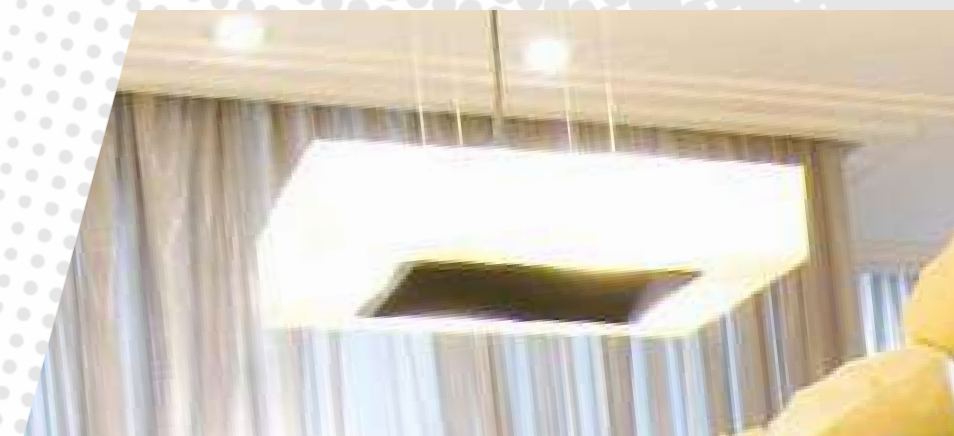
Vidro serigrafado para Luminárias

Vidros planos temperados incolores ou serigrafados para aplicação em luminárias e refletores.