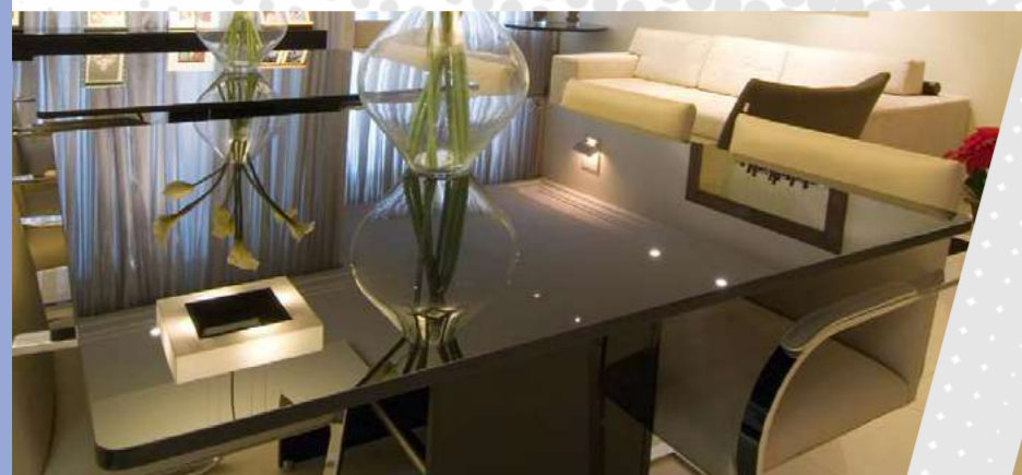
Tampo de mesa serigrafado

Vidros planos temperados incolores, serigrafados ou bisotê para aplicação na área moveleira.