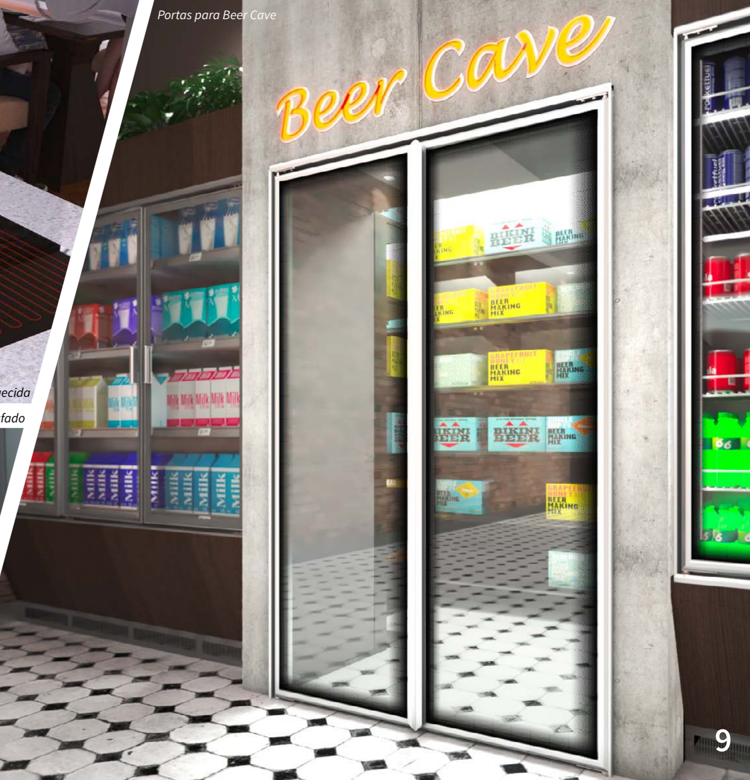
Portas para Beer Cave