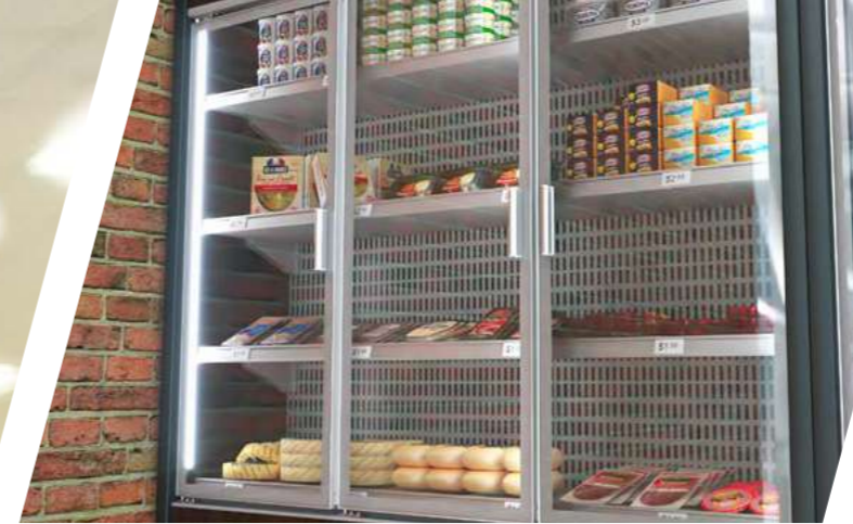
Frame resfriado serigrafado