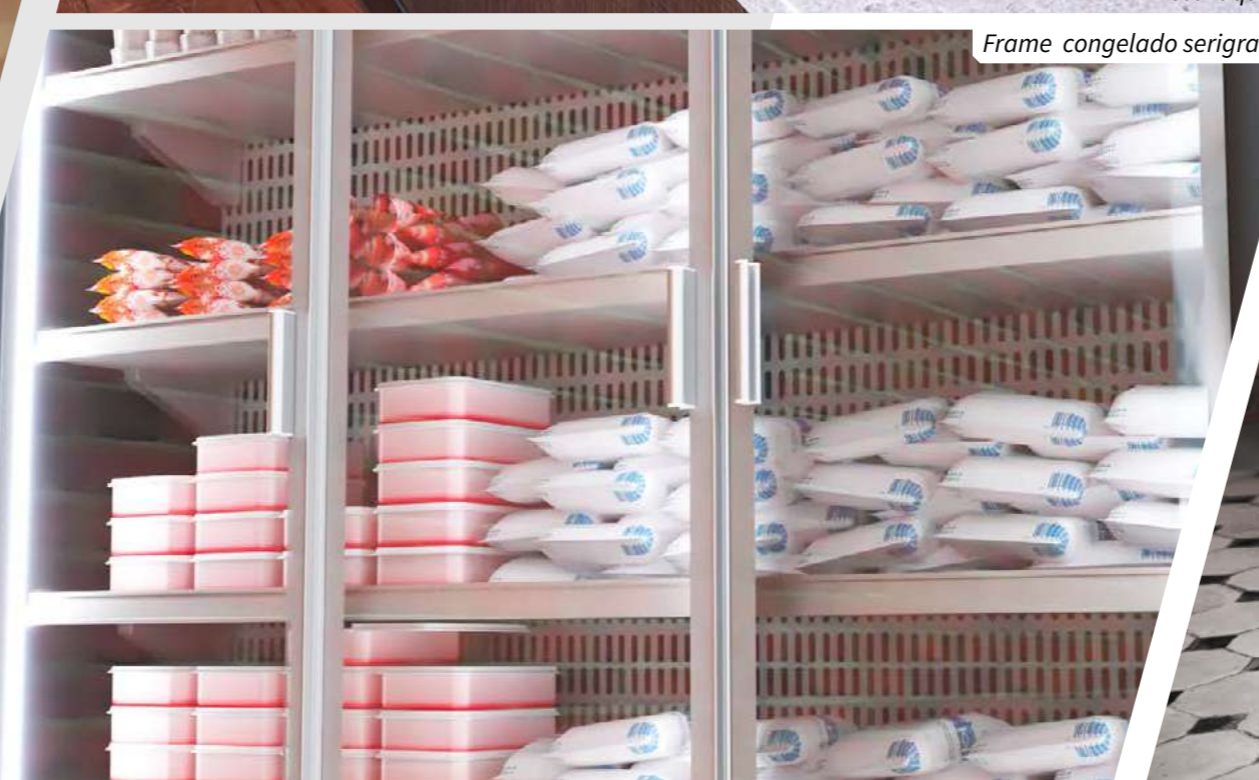
Frame congelado serigrafado